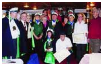
La famille de la confrérie des Avalants Navieurs

Après un début à Auxonne, l'attrait de Saint-Jean-de-Losne pour son passé et sa continuité de centre fluvial de navigation ouvre de nouvelles perspectives. Les élus du Pays losnais encouragent cette implantation sur le quai de